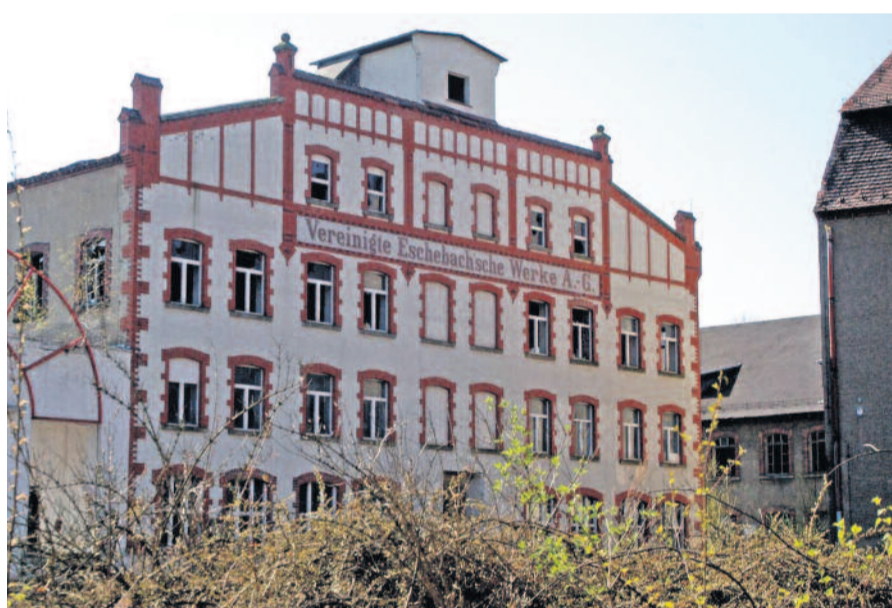
Langjährige Industriegeschichte: Das Gelände am Radeberger Bahnhof hat eine umfangreiche Historie. Bevor hier durch Carl Eschebach Küchen produziert wurden, begann alles mit den Saxonia Eisenwerken und Eisenbahnbedarf. 1886 übernahm Eschebach das Areal und schrieb ein Stück Heimatgeschichte.

Dazu wird ab der 6. Kalenderwoche verstärkt schwere Technik im Einsatz sein. So werden auch Außenstehende entsprechende Veränderungen wahrnehmen können. Der Abschluss der Beräumung ist für das Ende des 2. Quartals vorgesehen. Wie das Landratsamt weiter mitteilt, ist das Ausschreibungsverfahren