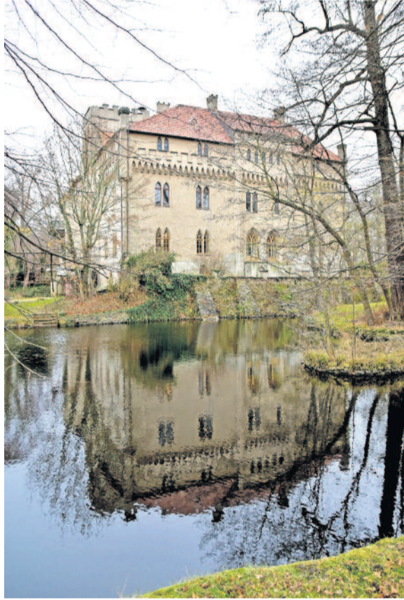
Ein idyllischer Anblick. Schloss Seifersdorf thront in der schönen Parkanlage am Schlossteich. Im Inneren gibt es derzeit viel zu tun und die Arbeiten schreiten voran.