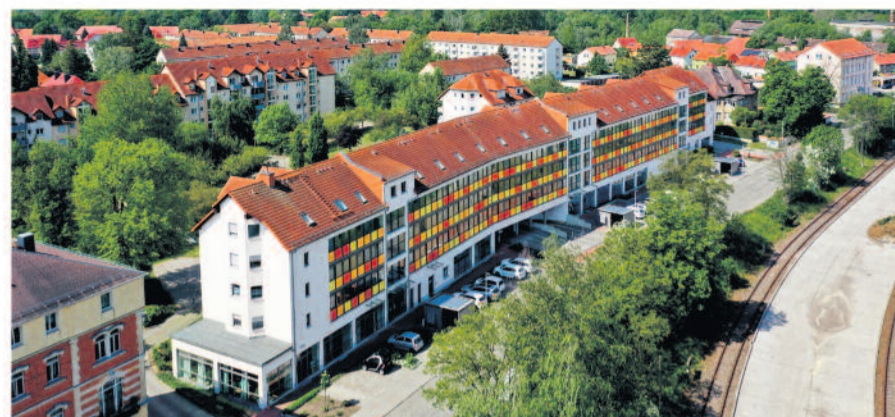
Das advita Haus Radeberg in Radeberg

Einen weiteren Vorteil, den das advita Haus Radeberg bietet: Das advita Haus liegt mitten in der Stadt. Unweit des Zentrums bietet das advita Haus bisher noch 61 Ein-, Zwei und Drei-Raum-Wohnungen - ab Februar 2023 kommen hier 14 weitere Wohnungen hinzu. Alles natürlich barrierefrei. Alltägliche Ziele, wie Apotheken, Supermärkte und Ärzte sind deshalb fußläufig erreichbar. Für reiselustige Mieter ermöglicht die zentrale Lage auch eine gute Anbindung an Bus und Bahn und erfüllt somit alle Anforderungen an ein selbstbestimmtes Leben sowie die Teilnahme am öffentlichen Leben - auch im hohen Alter! Im Haus befindet sich außerdem eine Tagespflege mit einem abwechslungsreichen Programm. Zusätzlich gibt es für die Mieter des Betreuten Wohnens abwechslungsreiche Veranstaltungen.