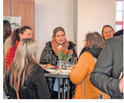
Im Spatzenhof-Café auf dem Gelände des Taubblindendienstes an der Pillnitzer Straße in Radeberg kamen die Gäste aus den unterschiedlichsten Institutionen und Vereinen in Gespräch und lernten sich kennen.