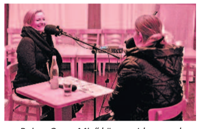
Beim „Open-Mic“ können Ideen und Denkansätze aus lockeren Gesprächen entstehen. Die Aufnahmen werden vom radeberg:werk genutzt, um dessen zukünftige Ausrichtung zu beeinflussen.