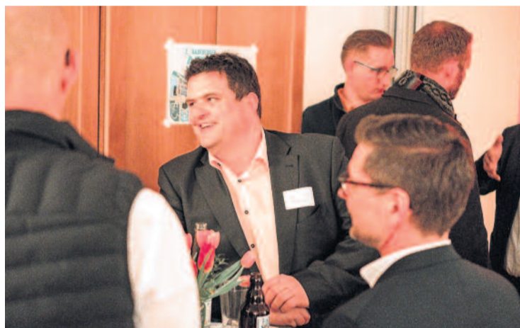
Zum Vernetzen aller Institutionen der Stadt bietet auch das radeberg:werk eine gute Plattform. Das nutzte auch OB Frank Höhme und traf zum 2. AfterWork im Botanischen Blindengarten des Taubblindendienstes auf interessante Leute.

können, möchte der Aktionsraum Rödertal ein Städte-Umland-Konzept erarbeiten. Dazu wird ein Fördermittelantrag über das Programm „FRL-RegioPlan“ gestellt. „Auf diesem Konzept bzw. dem Maßnahmenplan wollen wir aufbauen, Projekte umsetzen und dafür weitere Fördermittel generieren“, ergänzt Frank Höhme.