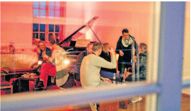
Die gemütliche Lounge-Atmosphäre mit Licht und Musik, für welche die Ultimate-Sound-Crew Radeberg sorgte, wird bei der 3. AfterWork-Veranstaltung am 21.09.2023 erneut für die passende Stimmung sorgen.