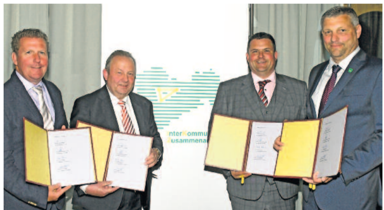
Am 14.06.2023 wurde es offiziell besiegelt. Nach den einzelnen Abstimmungen der Stadt- und Ortschaftsräte unterzeichneten die (Ober-)Bürgermeister den Vertrag zur interkommunalen Zusammenarbeit.