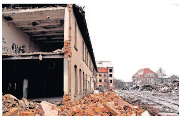
Im Frühjahr wurde mit den Abrissarbeiten begonnen. Die Arbeiten befinden sich laut dem Landkreis Bautzen aktuell voll im Zeitplan.