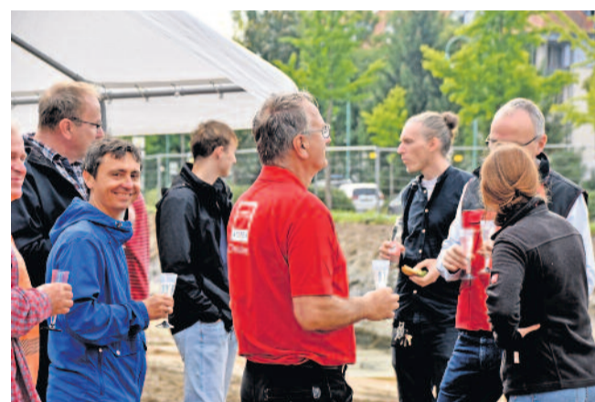
Am Mittwoch, dem 26.07.2023, wurde auf das Bauvorhaben mit allen Beteiligten sowie Vertretern der Stadt Radeberg angestoßen.

Im Anschluss wurde angestoßen und am 23. August 2023 erfolgt die Grundsteinlegung.