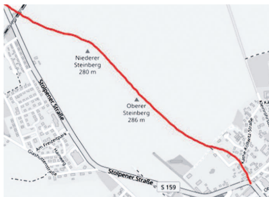
Warum die Stolpener Straße einst einen anderen Weg einschlug und was aus der ehemaligen Wegeführung geworden ist, lesen Sie im Artikel. © OpenStreetMap contributors (bearbeitet durch Klaus Schneider)

Elfriede Lohse Wächter war eine außergewöhnliche Malerin des Expressionismus und Patientin der Arnsdorfer Landesanstalt, bis sie 1940 im Verlauf der NS Euthanasie Aktion T4 in Pirna-Sonnenstein ermordet wurde.