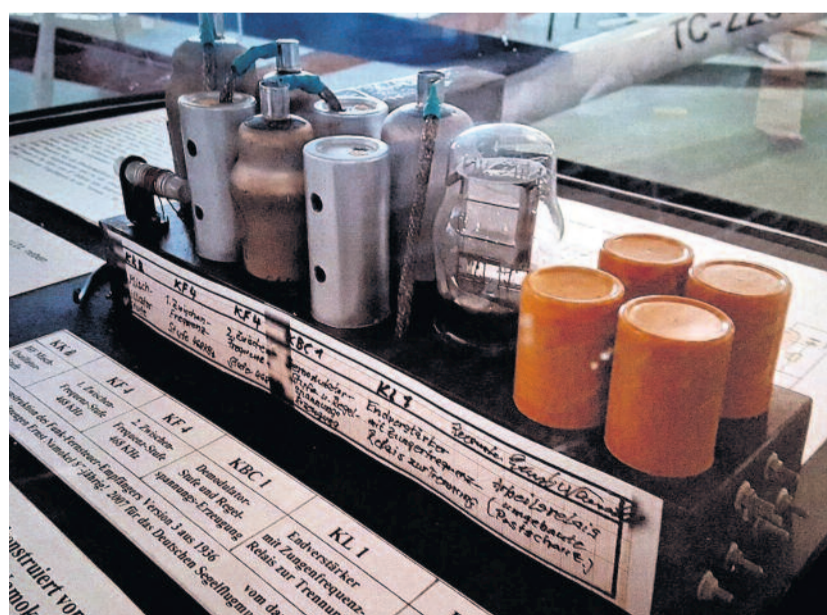
RC-Empfänger von 1936 (Nachbau 2007)