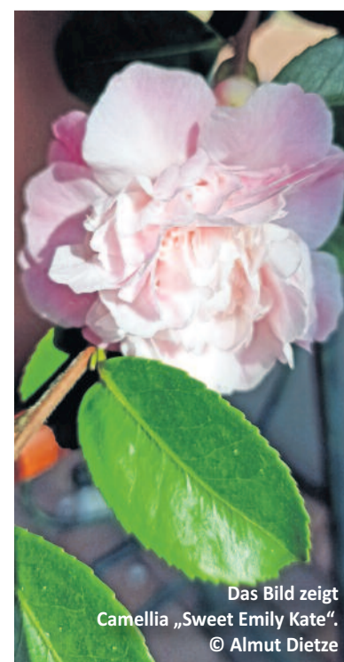
Das Bild zeigt Camellia „Sweet Emily Kate“. © Almut Dietze

Text & Foto: Botanischer Blindengarten Radeberg