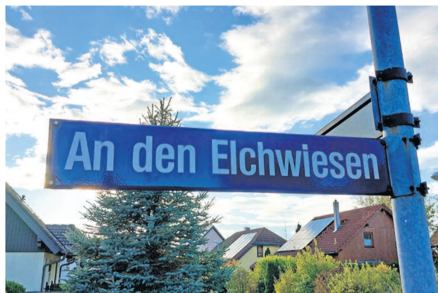
Die Straße an „An den Elchwiesen“ existiert nicht wirklich. Die dazugehörige Anekdote wird im Text beschrieben.